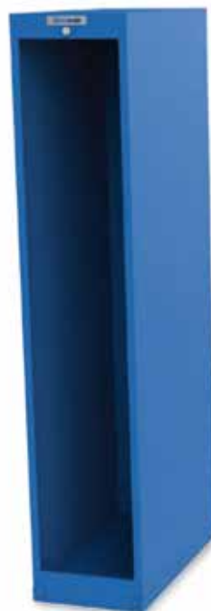
TSM® - Extension module