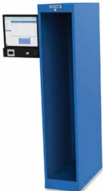
TSM® - Basic module ■ Incl. software di gestione ■ Con touch-display

Altezza massima interna utilizzabile 170mm